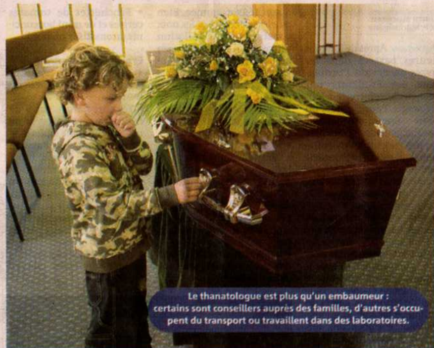
Le thanatologue est plus qu'un embaumeur : certains sont conseillers auprès des familles, d'autres s'occupent du transport ou travaillent dans des laboratoires.

La deuxième année est plus pratique. «C'est l'année la plus intéressante, mais aussi la plus difficile, indique M me Boulet. Les étudiants commencent alors leurs cours en laboratoire, où ils apprennent les techniques de soins de